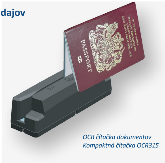
OCR čítačka dokumentov Kompaktná čítačka OCR315