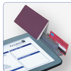
Čítačka OCR315 sa dobre integruje s klávesnicami, monitormi a tabletmi